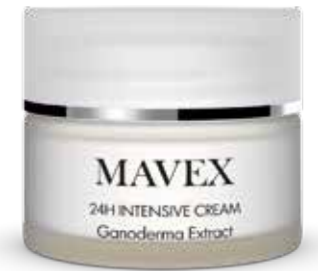
24 H Intensive Cream 50 ml

Wáár anti-aging elixir samengesteld uit een zeer zuivere hyaluronzuurgel met een dubbele filler-lifting werking: hervult en rekt expressierimpels uit met een onmiddellijk zichtbaar resultaat, bevordert de collageensynthese en houdt de huid tonisch, gehydrateerd en lumineus. Rijk aan Gonaderma, bestrijdt de huidveroudering en bevordert de celhernieuwing. De extracten van muizedoorn, gotu kola, Indische kastanje, calendula en zoethout handelen met een buitengewone doeltreffendheid door de bescherming en de verbetering van de aanblik van de gevoelige huid en rosacea. De resultaten zijn onmiddellijk zichtbaar, de huid - gevoed met kostbare en natuurlijke actieve stoffen - herwint een nieuwe luminositeit en een delicate zijde-achtige zachtheid.