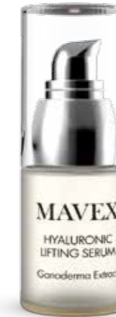
Hyaluronic Lifting Serum 15 ml

Revolutionaire 2-in-1 thuisbehandeling. Doet dienst als enzymatische peeling en als uiterst efficiënt masker. Heeft, dankzij het hoge gehalte aan papaiïne, een krachtige enzymatische exfoliërende werking die onvolmaaktheden vermindert en de huid onmiddellijk gladder, lumineuzer en geoxideerder maakt. Bevordert de diepgaande penetratie van de kostbare papajaextracten en in het bijzonder het reishi-extract, dat in staat is een krachtige antioxiderende werking en een diepgaande celvernieuwing op gang te brengen. Vertraagt overigens doeltreffend het degeneratieproces en de negatieve werking van vrije radicalen. Deze innovatieve verjongingsbehandeling is de ideale oplossing voor zij die op zoek zijn naar een echt efficiënt product, geschikt voor alle huidtypes voor het gelaat, de hals en de buste. Zeer eenvoudig te gebruiken, snel en gegarandeerd onmiddellijke resultaten. Kan ook worden gebruikt onder de douche, waar de warme damp het buitengewone effect van de enzymen activeert en verhoogt.