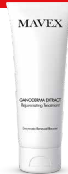
Rejuvenating Treatment 75 ml

Revolutionaire 2-in-1 thuisbehandeling. Doet dienst als enzymatische peeling en als uiterst efficiënt masker. Heeft, dankzij het hoge gehalte aan papaiïne, een krachtige enzymatische exfoliërende werking die onvolmaaktheden vermindert en de huid onmiddellijk gladder, lumineuzer en geoxideerder maakt. Bevordert de diepgaande penetratie van de kostbare papajaextracten en in het bijzonder het reishi-extract, dat in staat is een krachtige antioxiderende werking en een diepgaande celvernieuwing op gang te brengen. Vertraagt overigens doeltreffend het degeneratieproces en de negatieve werking van vrije radicalen. Deze innovatieve verjongingsbehandeling is de ideale oplossing voor zij die op zoek zijn naar een echt efficiënt product, geschikt voor alle huidtypes voor het gelaat, de hals en de buste. Zeer eenvoudig te gebruiken, snel en gegarandeerd onmiddellijke resultaten. Kan ook worden gebruikt onder de douche, waar de warme damp het buitengewone effect van de enzymen activeert en verhoogt.